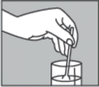
Рис.4. Гель принимают в чистом виде или разводят перед приемом в половине стакана воды.