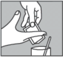
Рис.3. Выдавите пальцами гель через отверстие в пакетике.