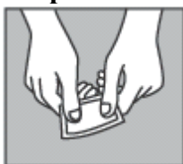
Рис.1. Тщательно разомните содержимое пакетика между пальцами для получения однородного геля.